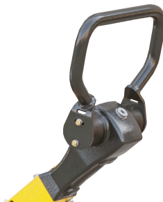
Präzise und sicher bedienbar Komfort-Hebel-Steuerung